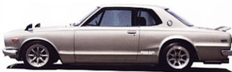
やはり素晴らしい納品車も、快適な走行性能を多量に誇る。前後15インチのリアホイールの取付には、4輪ともディスク化されたブレーキが優れている。この美しいスタイルを持つスカイラインも、現代的な性能でドライブできるのだから驚かす。